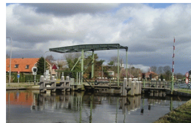
“De Brug” in Beerzerveld

Het gemeentelijk beleid moet er op gericht zijn op zoek te gaan naar kwetsbare medeburgers.